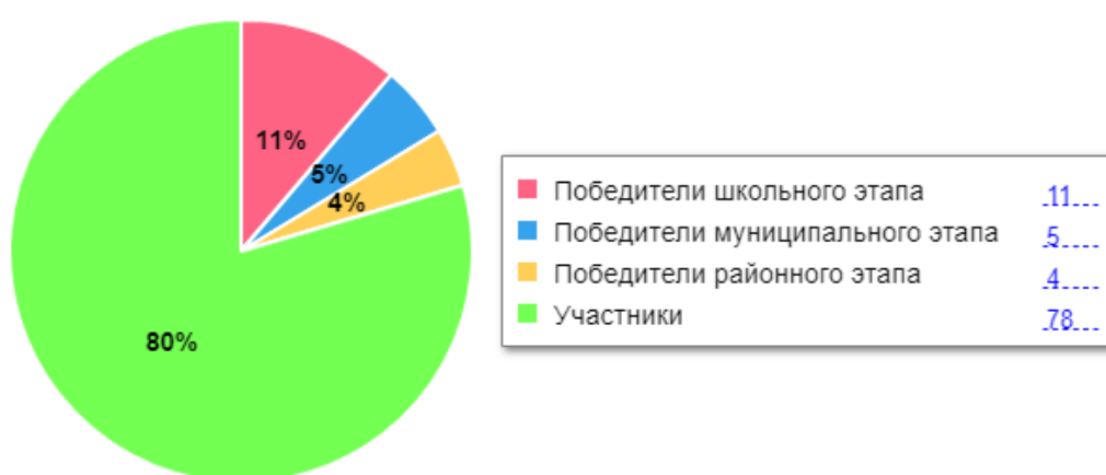
Диаграмма по результатам участия школьников во ВсОШ